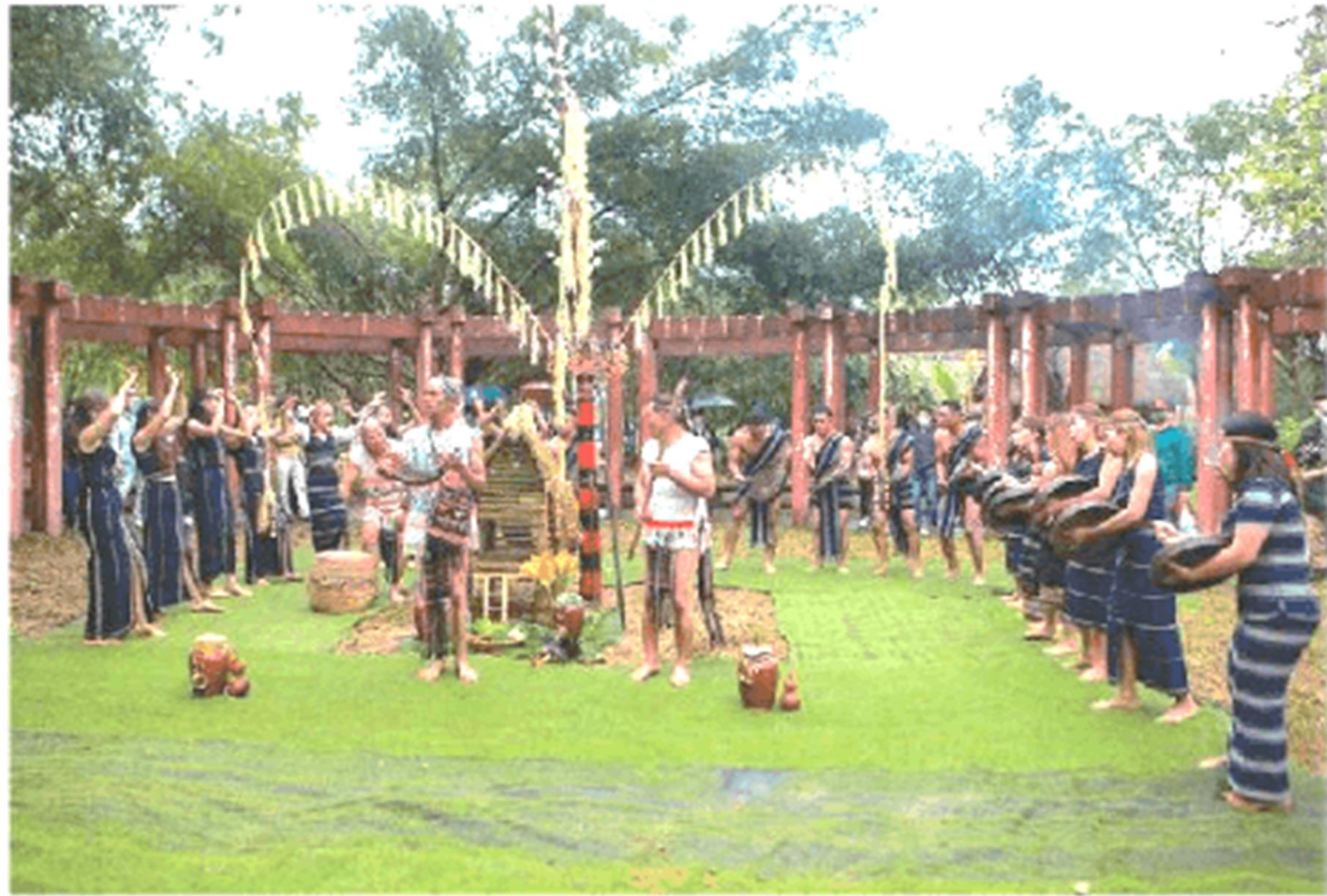
▲ Hình 1. Đánh cồng chiêng trong lễ Mừng lúa mới của dân tộc Cơ Ho (tỉnh Lâm Đồng)