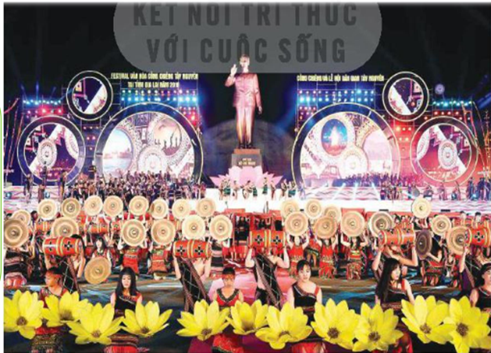
▲ Hình 2. Lễ hội Cồng chiêng Tây Nguyên năm 2018 (tỉnh Gia Lai)

Đọc thông tin và Quan sát hình 2, em hãy mô tả những nét chính về lễ hội Cồng chiêng Tây Nguyên.